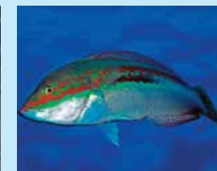
17-17/יג יולית ים-תיכונית