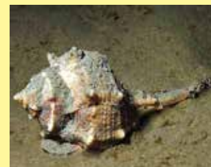
6-6/ב ארגמון חד-קוצים