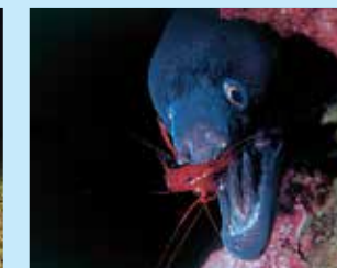
17-17/ג מורנה ים-תיכונית