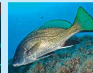
17-17/ט אוכם גדול-קוץ