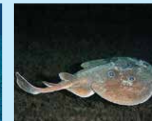
17-17/א חשמלן עיבוני