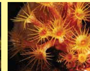
4-4/ב זואנטיד מושבתי