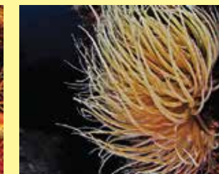
4-4/א דונגית צורבת