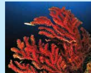
3-3/ב אלמוג גורגוניה