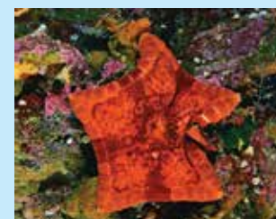
13-13/א כוכבן מחומש