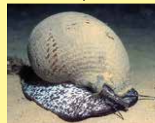
6-6/א חביונית גדולה