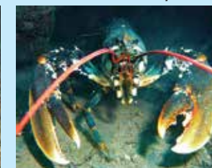
9-9/א לובסטר אירופי