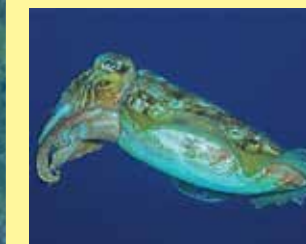
8-8/ב דיונון מצוי