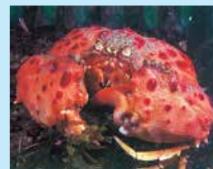
9-9/ד ביישן מתחפר