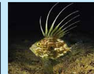
17-17/ד ג'ון דורי