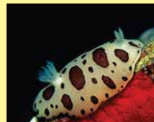
6-6/ג חלזון ים מנוקד