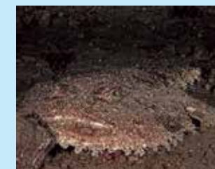
17-17/יד חכאי שדי

הפעילות האנושית גורמת לאובדן של צמחים ובעלי חיים רבים, יוצרת סביבות חיים משתנים ולא טבעיים, שהם הומוגניים מבחינה ביולוגית משום שהם נשלטים על ידי מספר קטן של מינים עמידים. לעומת זאת, סביבת חיים טבעיים, ללא שינוי, מציגים דרגה גבוהה של המגוון הביולוגי, שכן מינים רבים של צמחים ובעלי חיים מתקיימים במאזן אקולוגי. על ידי מילוי שאלון הסקר לאחר הצלילה שלכם, אתם תעזרו לנו להעריך את המגוון הביולוגי של הסביבה שאתם צללתם בה, ומאפשרים לנו להעריך את מצב בריאותו. בדקו את תוצאות המחקר שלנו באתר הרשמי של הפרוייקט: DUEproject.org פרוייקט מאת: P. Neri, C. Piccinetti, F. Zaccanti, S. Goffredo צלם רשמי: F. Sesso צילום 2/A: Esculapio תמונת השער: J.M. Mille עיצוב גרפי: Lauri Projects