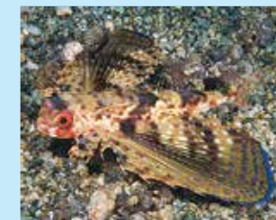
17-17/ז טיר ים-תיכוני