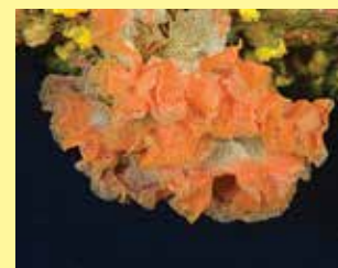
10-10/ב תחרה ימית