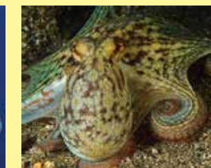
8-8/א תמנון החוף