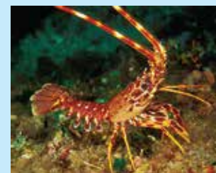
9-9/ב לובסטר קוצי