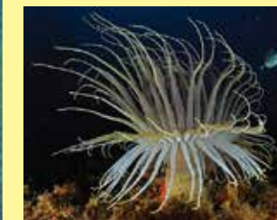
4-4/ג שושנת טיוב