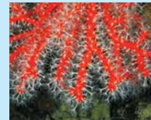
3-3/א קוראל אדום