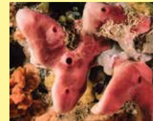
2-2/ב ספוג ים טרשי