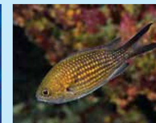
17-17/יב כרומית ים-תיכונית