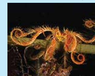
11-11/א חבצלת ים תיכונית