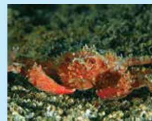
9-9/ג עכובית ים-תיכונית