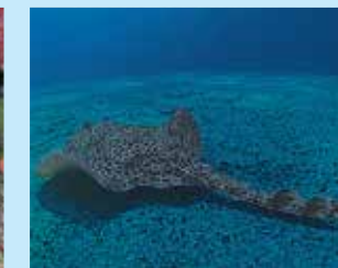
17-17/ב תריסנית קוצנית