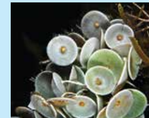
1-1/א האצה סוככנית