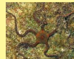
14-14/א גלדנית ארוכת זרועות