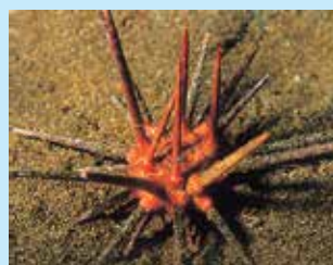
15-15/א צדר קהה-קוצים