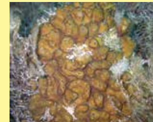
2-2/א כריתן ים-תיכוני