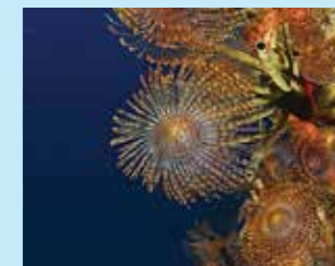
5-5/א נרתיקנית ים תיכונית