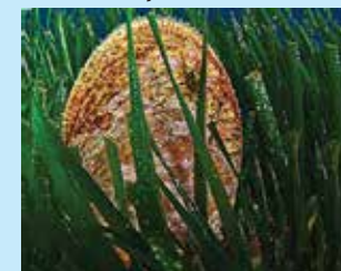
7-7/א מניפנית אצילה