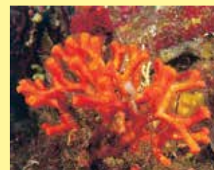
10-10/א אלמוג חקיין