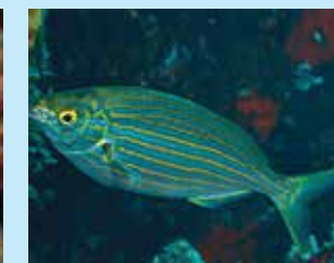
17-17/י סלפית צהובת-פסים