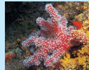
3-3/ג רפיונית האצבעות