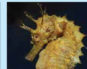
17-17/ה סוסון-ים מדובלל