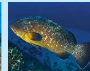
17-17/ח דקר הסלעים