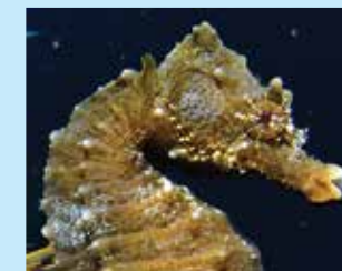
17-17/ו סוסון-ים ים-תיכוני