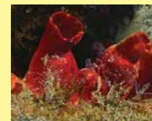
16-16/א אצטלן תפוז