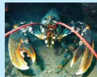
9/A - astice