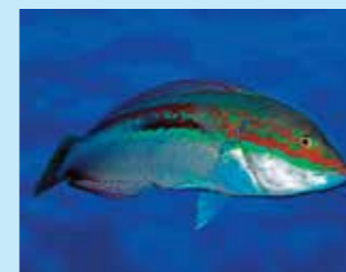
17/N - donzella