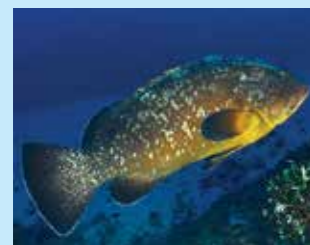
17/H - cernia bruna