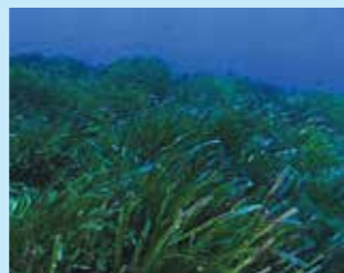
1/C - posidonia