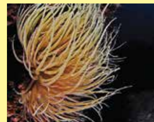
4/A - anemone di mare