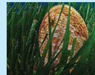
7/A - pinna