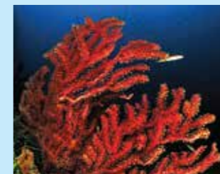
3/B - gorgonia rossa