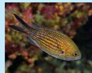
17/M - castagnola