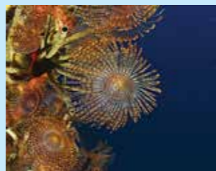
5/A - spirografo