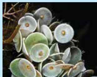
1/A - ombrellino di mare