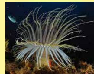
4/C - ceriario