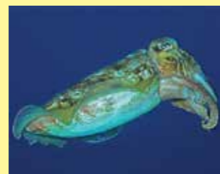
8/B - seppia