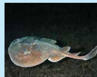
17/A - torpedine ocellata