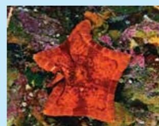
13/A - stella pentagono