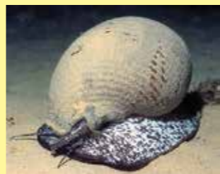
6/A - doglio