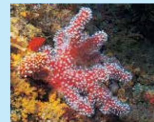
3/C - mano di San Pietro