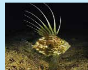
17/D - pesce San Pietro