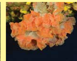
10/B - trina di mare