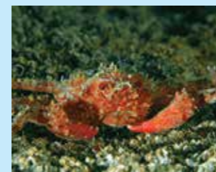
9/C - granceola