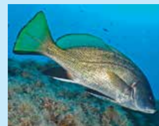
17/I - corvina