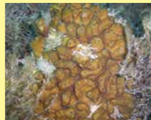
2/A - condrilla