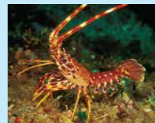
9/B - aragosta