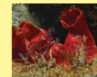
16/A - patata di mare