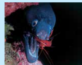
17/C - murena