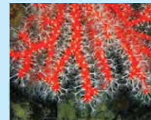
3/A - corallo rosso