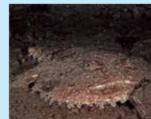
17/O - rana pescatrice

Le attività dell'uomo causano la scomparsa di molte piante e animali, creando ambienti alterati, innaturali che sono biologicamente omogenei perché dominati da un numero ridotto di specie resistenti. Gli ambienti inalterati, naturali presentano invece un elevato grado di biodiversità perché in essi vivono molte specie vegetali e animali in equilibrio ecologico. Compilando questa scheda di rilevamento dopo la tua immersione, ci aiuterai a stimare la biodiversità dell'ambiente in cui ti sei immerso, permettendoci di valutare il suo stato di salute. Guarda i risultati della nostra ricerca: DUEproject.org Ideazione del progetto: M. Meschini, C. Piccinetti, F. Zaccanti, S. Goffredo Fotografo ufficiale: F. Sesso Foto 2/A: Esculapio Foto in copertina: J.M. Mille Realizzazione grafica: Lauri Projects