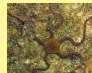
14/A - stella serpentina liscia