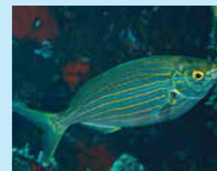
17/L - salpa