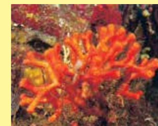
10/A - falso corallo