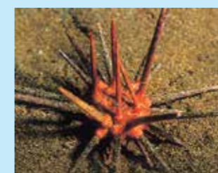
15/A - riccio saetta