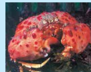
9/D - granchio melograno