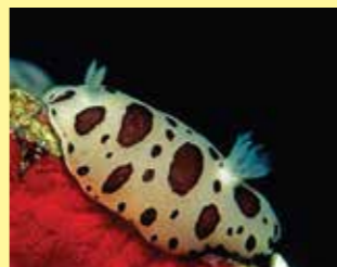
6/C - vacchetta di mare