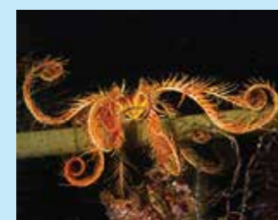
11/A - giglio di mare