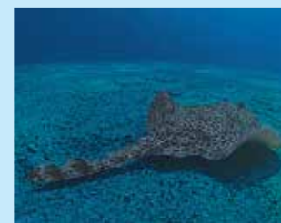
17/B - razza chiodata