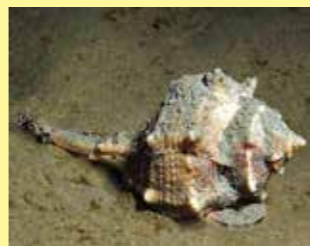
6/B - murice spinoso