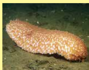
12/A - lingua di mare