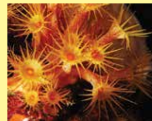
4/B - margherita di mare