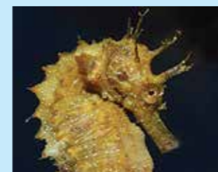
17/E - cavalluccio ramuloso