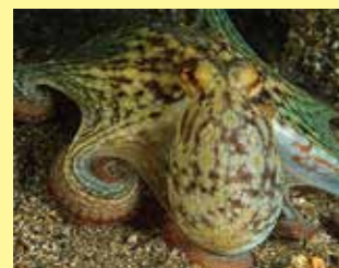
8/A - polpo comune