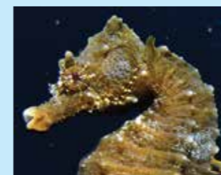
17/F - cavalluccio camuso