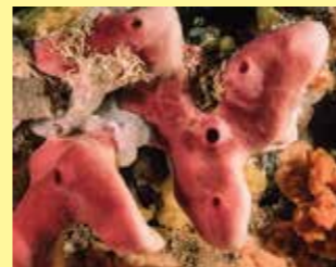
2/B - petrosia