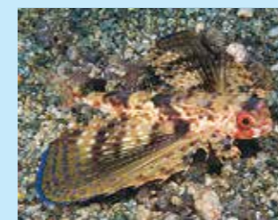
17/G - pesce civetta